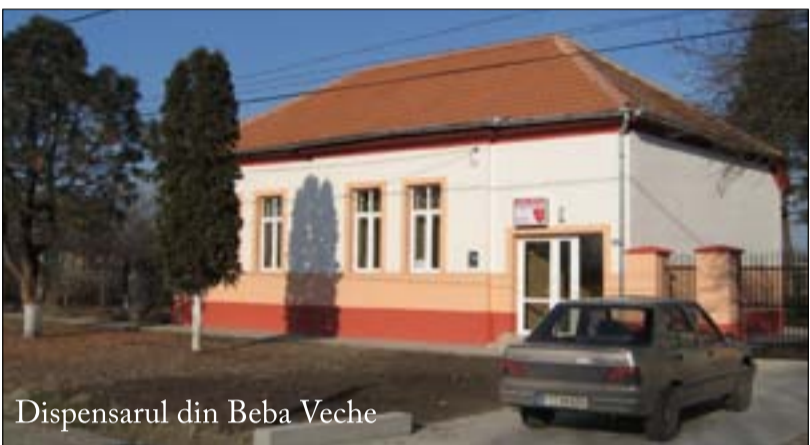
Dispensarul din Beba Veche

Variașul este una dintre cele mai mari comune din Timiș, cu o populație de circa e 6.000 de locuitori, din care 4.400 sunt numai la Variaș. Pentru a menține tinerii în comună și pentru a le satisface doleanțele, primarul a dorit să facă blocuri prin ANL, s-a realizat și un plan