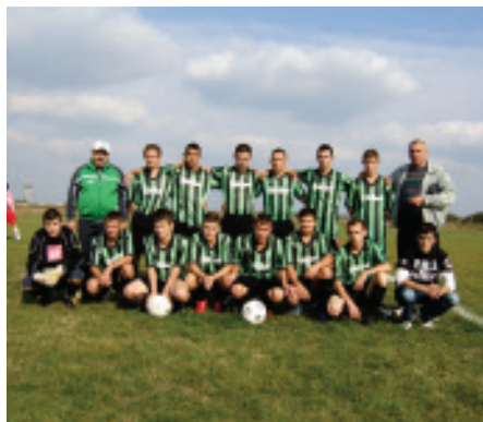
A.S. HOG LENAUEIM

Comuna noastră are două echipe, HOG Lenaueim și Steaua Roșie Bulgăruș, ce activează în seria I- a a campionatului "Promoție".